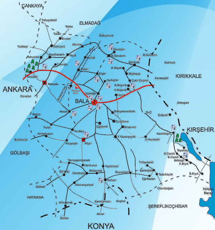
Şekil 3 - Bala İlçe Haritası