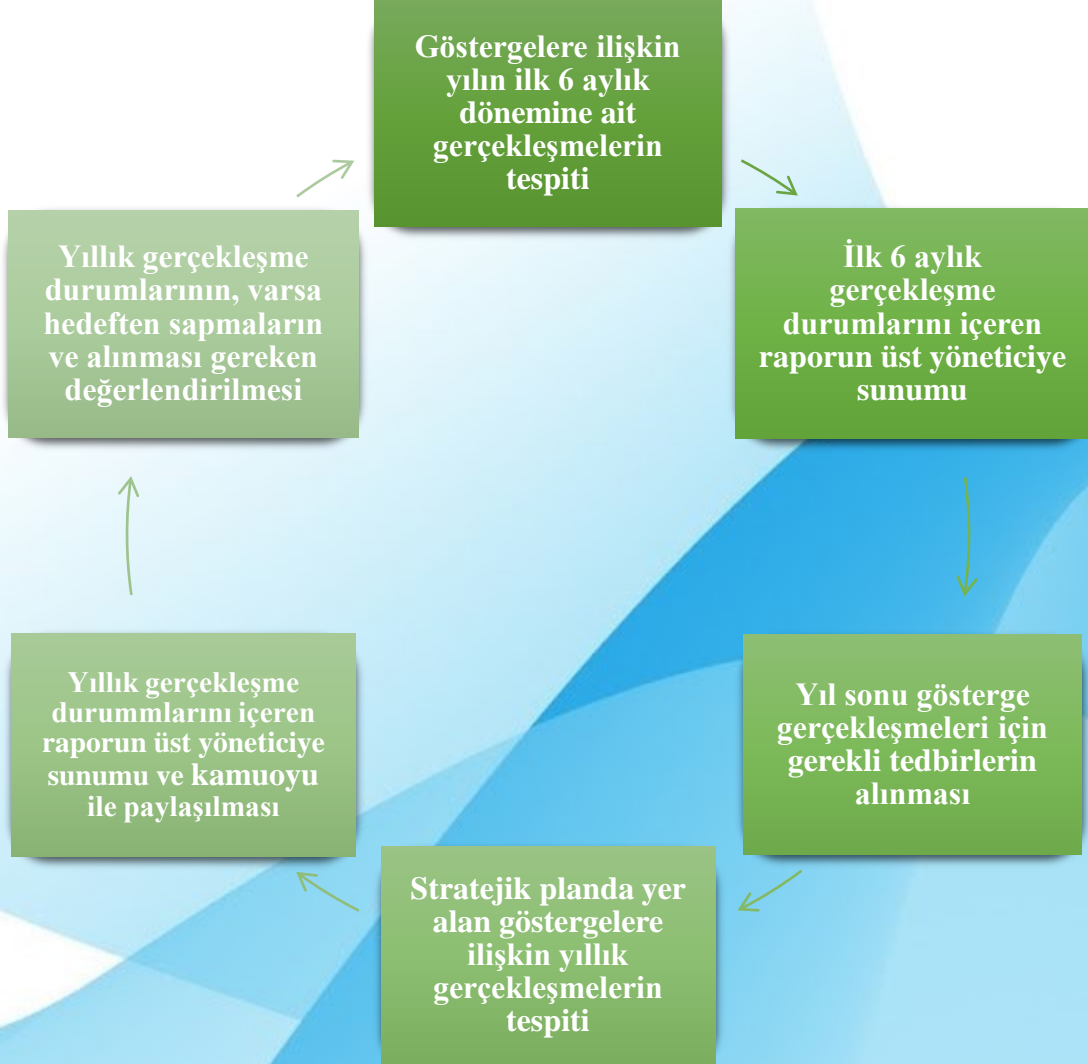
Şekil 5 - Bala MEM 2015-2019 Stratejik Planı İzleme ve Değerlendirme Modeli