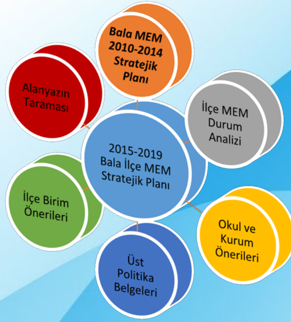
Şekil 2-Stratejik Plan Oluşum Şeması

2015 – 2019 Stratejik Planı uygulanma aşamasında nasıl izlenip değerlendirileceği ile ilgili bilgilerin yer aldığı bölümdür.