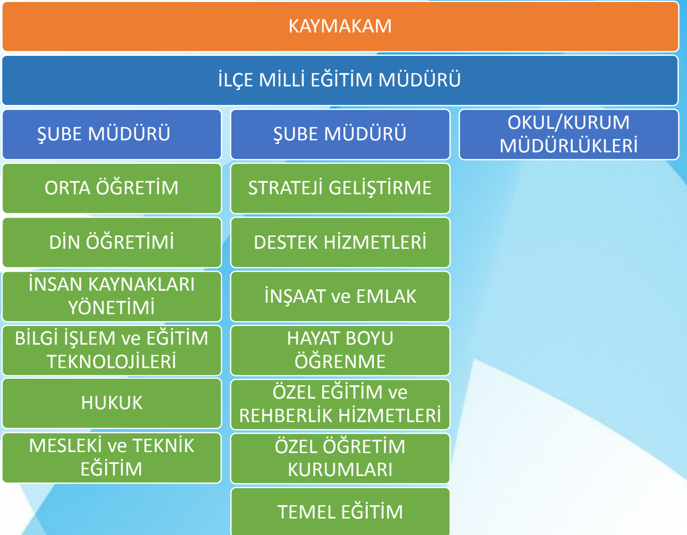
Őekil 4 - İle MEM Organizasyon Őeması

Bala İle Milli Eđitim Mdrlğne bađlı, 13 blm bulunmakta olup, kuruluş yapısında yetkilerin paylaŐımı anlayıŐıyla yatay rgtlenme modeli benimsenmiŐtir. 18.11.2012 tarih ve 28471 sayılı Resmi Gazete'de yayınlanan İl ve İle Milli Eđitim Mdrlkleri Ynetmeliđi ve MEB 2012/43 sayılı Genelgeye gre hazırlanmıŐtır.